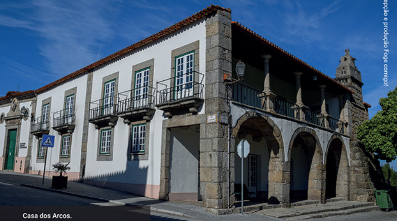
Casa dos Arcos.