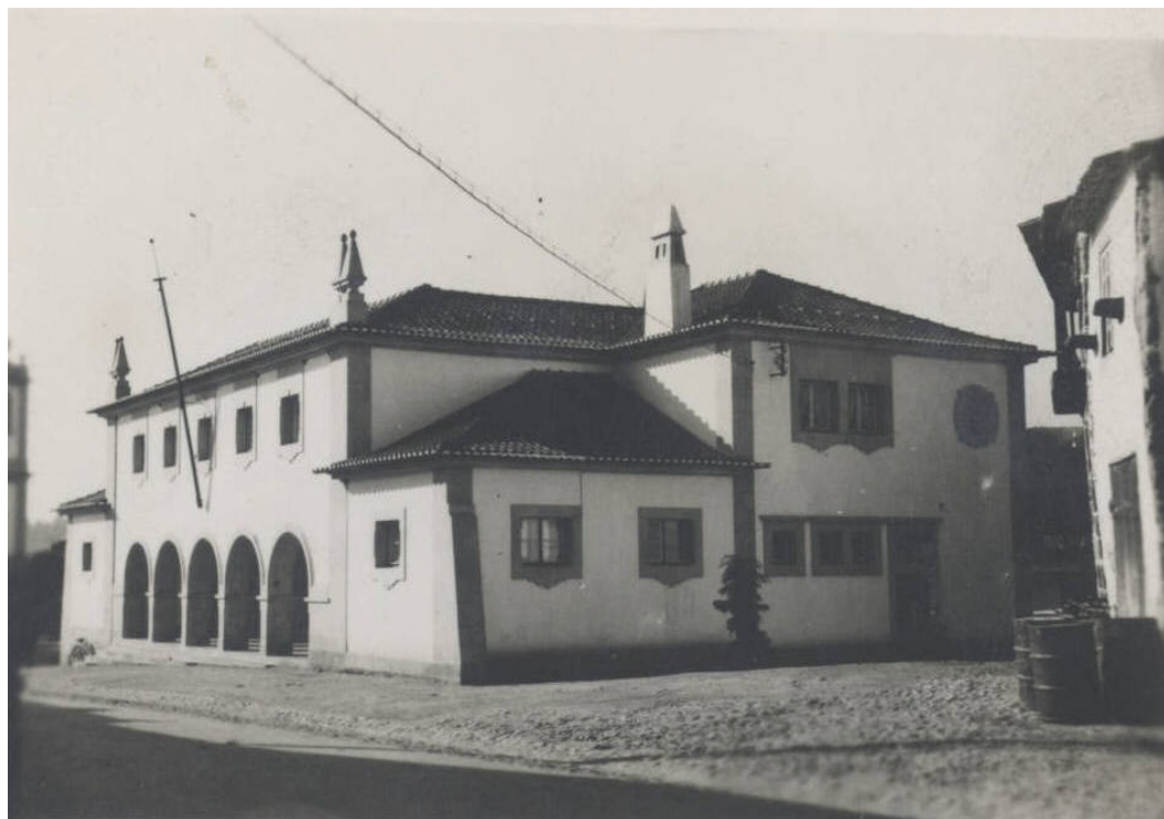
1950 – Edifício dos C.T.T. e da C.G.D. de Santa Comba Dão.

O edifício dos Correios, Telégrafos e Telefones e da Caixa Geral de Depósitos foi inaugurado a 28 de abril de 1948, um projeto que demorou mais de 10 anos a ser concretizado. Com efeito, já no início dos anos 30 a Câmara Municipal discutia a necessidade de se construir um edifício para os serviços dos CTT, que até então funcionavam em casa arrendada. No final dessa década, a Câmara compra um prédio sito na esquina das ruas Miguel Neves e Dr. Luís Albano, terreno esse que é aprovado pela Administração Geral dos Correios e Telégrafos, a quem é cedido para a construção do edifício. Em dezembro de 1938, a Câmara manda demolir a casa existente no terreno onde se iria construir o edifício dos CTT. Contudo, em maio de 1941 é acordada uma permuta entre a Associação dos Bombeiros Voluntários e a Câmara Municipal; esta cede o terreno que possuía na R. Miguel Neves, esquina com a R. Dr. Luís Albano, e 17.000$00 em troca de um prédio que os Bombeiros Voluntários tinham nas ruas Santa Columba, Albino Vieira e beco da Madragoa. Em 1943, a Comissão dos novos edifícios dos CTT envia o projeto do novo edifício que é inaugurado 5 anos mais tarde.